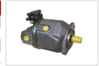
Load-sensitive pilot valve